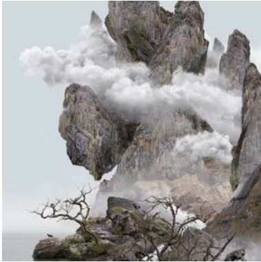
HOUND Yang Yongliang (*1980 Shanghai/CHN) Original Lithograph, limited edition, signed and numbered