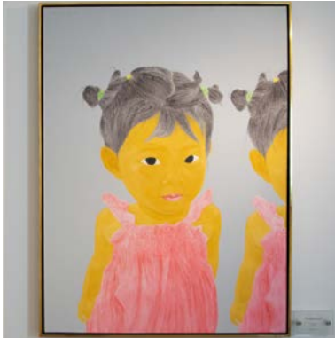
I'M DISPLEASURE Han Feng (*1970 Qinzhou/CHN) Original, Acrylic