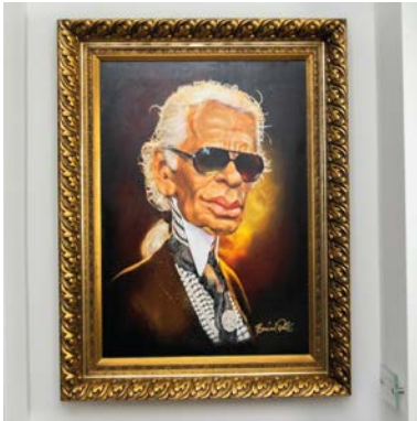
KARL DER GROSSE Bernhard Prinz (*1975 München/D) Original, Oil